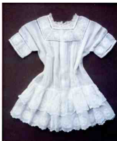
Het bruidsjurkje dat Toos nog steeds bewaard heeft