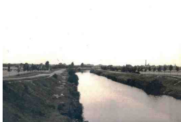
Zicht op het kanaal vanaf de Laarbrug richting Lieshout