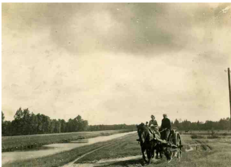
Een boerenechtpaar nadert met 'de hoog kar' de Laarbrug, komende vanaf de Laarweg