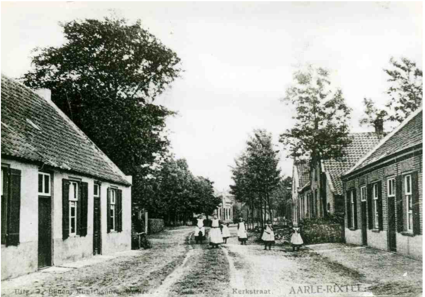
De (nog onverharde) Kerkstraat in de twintiger jaren van de vorige eeuw, richting Dorpsstraat

Wel te rusten ..... ast God belieft, zei ons Moeke dan.