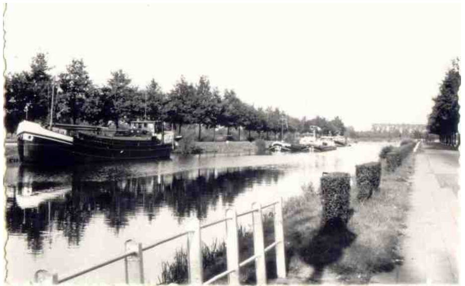
Aangemeerde schepen aan de oostkant van de 'Beekse' brug

op financieel gebied van groot belang is. Het behoeft geen betoog, dat dusdanige onderneming zeer ten bate zal komen van den arbeidenden en den neringdoenden stand.