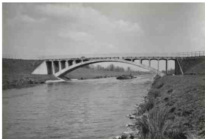
De eerste Laarbrug, een betonnen loopbrug