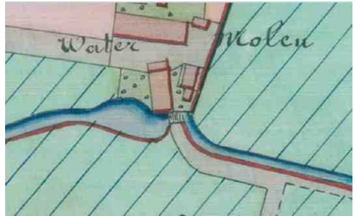
Linksonder de watermolen en rechts het molenhuis (fragment van een kaart uit 1875)

Uiteindelijk werd in 1885 de water-, graan- en oliemolen door Fritsen afgebroken, net als het door hem gekochte Gulden Huijs.