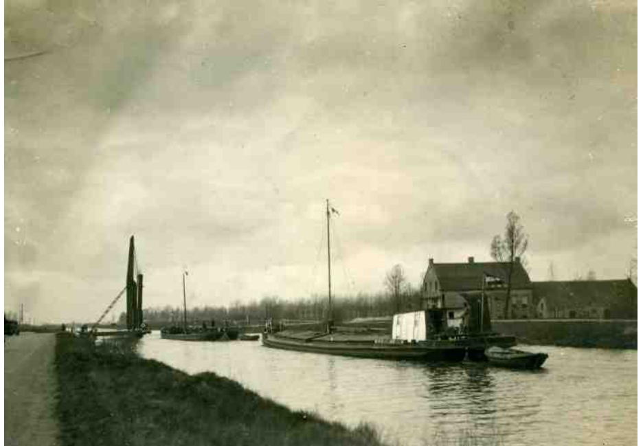
Twee Kempenaren met De Hommel rechts

In Aarle-Rixtel zouden reeds de rails voor de wagentjes tot vervoer van het zand gelegd zijn, ware de waterstand dezer dagen niet zoo enorm gestegen. De dorpen Aarle-Rixtel en Lieshout staan nu op een keerpunt, dat voor hen zoowel op economisch als