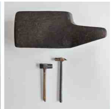
Hamers groot en klein

hout gebruikt voor hamerstelen die grote kracht moesten kunnen verdragen. Essenhout is een houtsoort die taai is en moeilijk breekt of scheurt. De es is een boomsoort die vroeger dan ook veel werd aangeplant in houtwallen of geriefbosjes. Het hout was zo beschikbaar voor gereedschapsstelen (ook voor schoppen en rieken). Hamers, die voor fijngevoelige, speciale doeleinden werden gebruikt waarbij flexibiliteit belangrijk was, kregen een steel van vruchtbomenhout, van het uitheemse ebbenhout of voor heel specialistisch gebruik (horlogemaker) van hoorn. Metalen stelen voor een hamer zijn i.v.m. het doorgeven van trillingen niet echt comfortabel. Dit werd opgelost door de hamer een 'jasje' van hout, kunststof of rubber te geven om de grip en de schokbestendigheid te verbeteren. Ook de vorm van de steel (kort, lang, rond, ovaal, maar ook speciale vormen) kent heel wat variëteiten en speciale kenmerken, aangepast aan het gebruik.