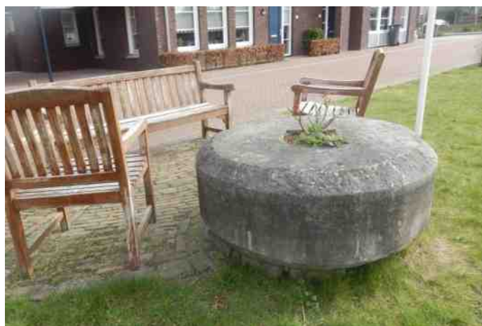
Oude maalsteen op pleintje in De Zes Gehuchten