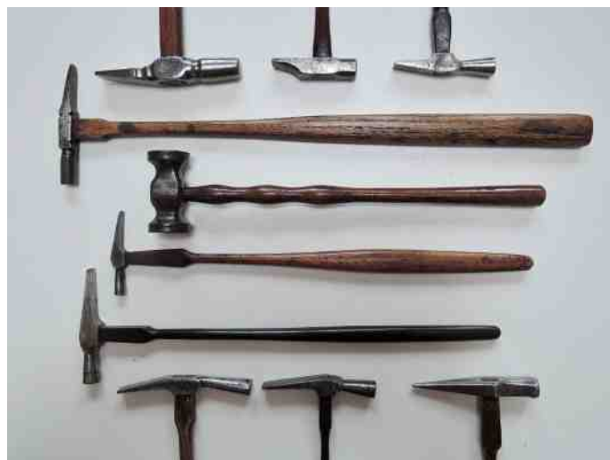
Hamers voor juweliers en horlogemakers

Niet alleen de kop van de hamer kent variaties in materiaal (koper, brons, gietijzer, smeedijzer, staal, hout, rubber, kunststof). Ook de steel kent heel wat verschillende vormen en materiaalsoorten. Werd oorspronkelijk een willekeurige houtsoort gebruikt die gemakkelijk te verwerken en bovendien voorhanden was, later werd ook over de steel van de hamer beter nagedacht. Zo werd er vaak essen-