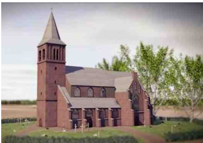
Impressie van de kerk van Aarle

De kerklocaties zijn een teken van de strijd tussen een protestantse overheid (overheersing) en een ondergeschikte katholieke bevolking. Het is de tijd van de Tachtigjarige Oorlog, 1568 - 1648, een periode waarin deze streek losgeweekt is uit het oude hertogdom Brabant en tot onderdeel van Staats-Brabant werd gemaakt. Ook een tijd van geloofsonderdrukking; katholieken mochten niet openlijk hun geloof uitoefenen. Men kreeg te maken met rondtrekkende legerbenden die brand stichtten en geld en onderhoud eisten. Hele dorpen werden deels of zelfs geheel ontvolkt en verwoest. De bevolkingsomvang nam met bijna 70% af in deze periode! Nationaal wordt deze periode gezien als de tijd van de bevrijding van Nederland, maar dat is het voor Brabant allerminst. Holland profiteerde, terwijl de plattelandsbevolking van Brabant voortdurend de prijs betaalde. De Gouden Eeuw van Holland (17e