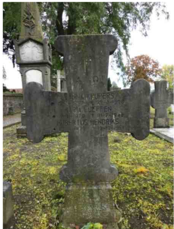
Ook grafstenen kunnen een bron van informatie zijn