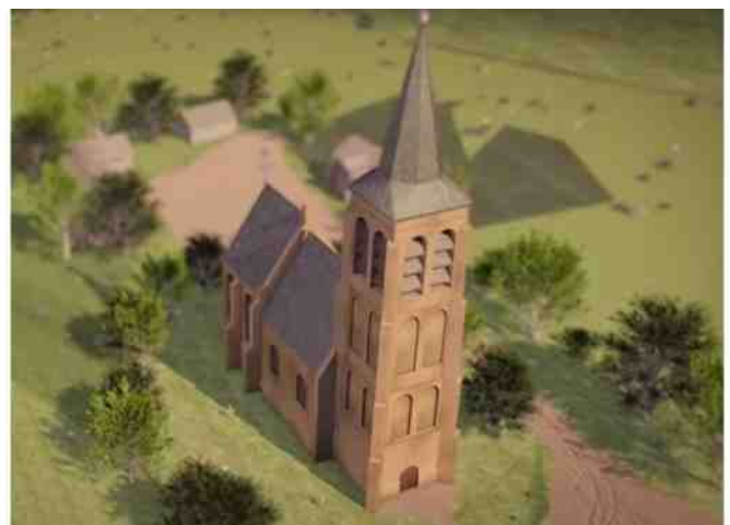
Impressie van de kerk van Rixtel