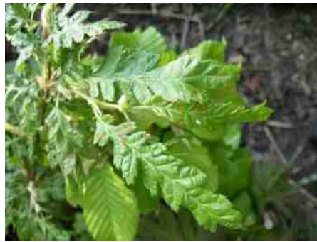
Carpinus betulus 'Quercifolia'

De botanische geslachtsnaam Carpinus is de naam waaronder de boom bij de Romeinen al bekend stond en die door Linneaus in 1753 is overgenomen. Er kan verband zijn met het Latijnse werkwoord carpere , dat wij kennen van de uitdrukking 'carpe diem' = 'pluk de dag', maar een bredere betekenis heeft van (herhaaldelijk) kappen tot aan sarren toe: een boom die je vaak kunt snoeien