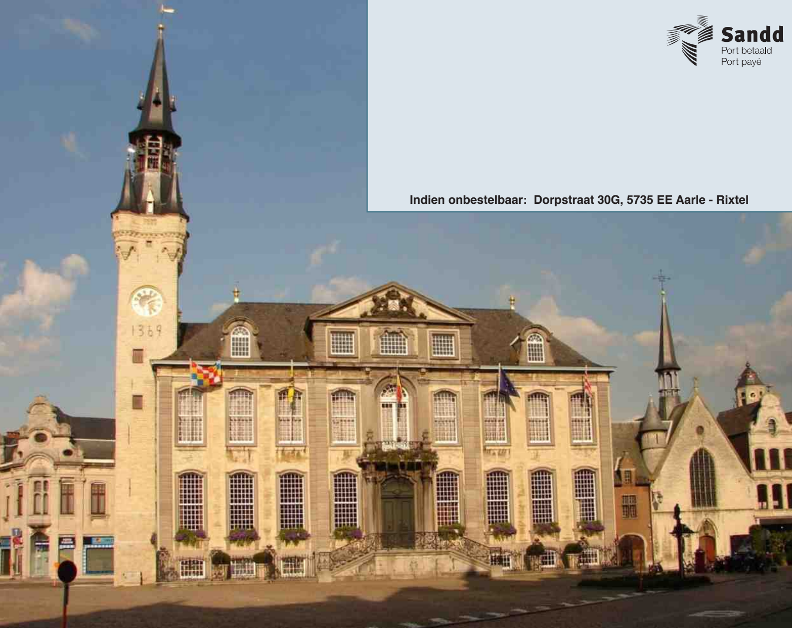
Stadhuis op de Grote Markt in Lier

Indien onbestelbaar: Dorpstraat 30G, 5735 EE Aarle - Rixtel