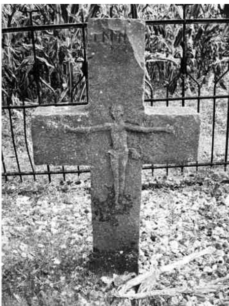
Het Hagelkruis op de Hooge Akkers in Aarle-Rixtel