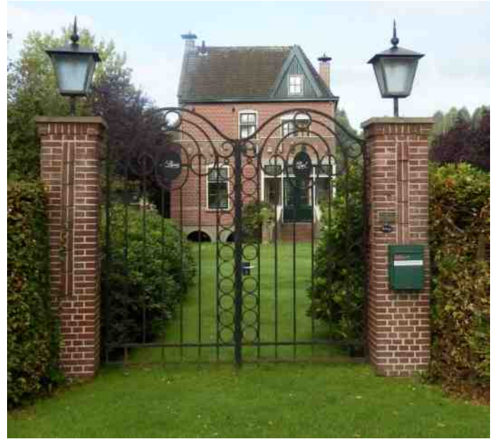
De poort aan de achterzijde, afkomstig van het voormalige Peapark in Helmond