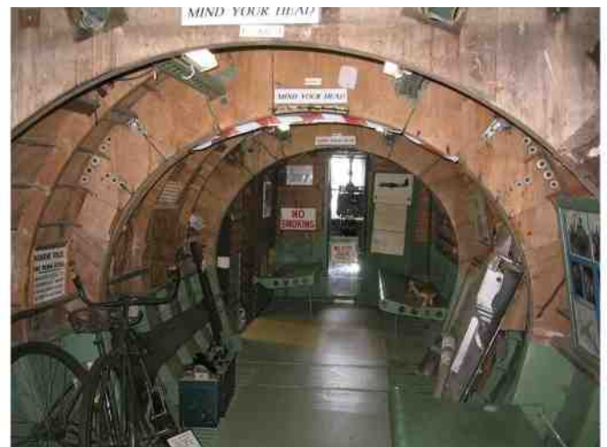
Interieur van een glider