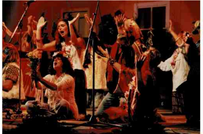
Flower Power: veel 'Love' en 'Peace'