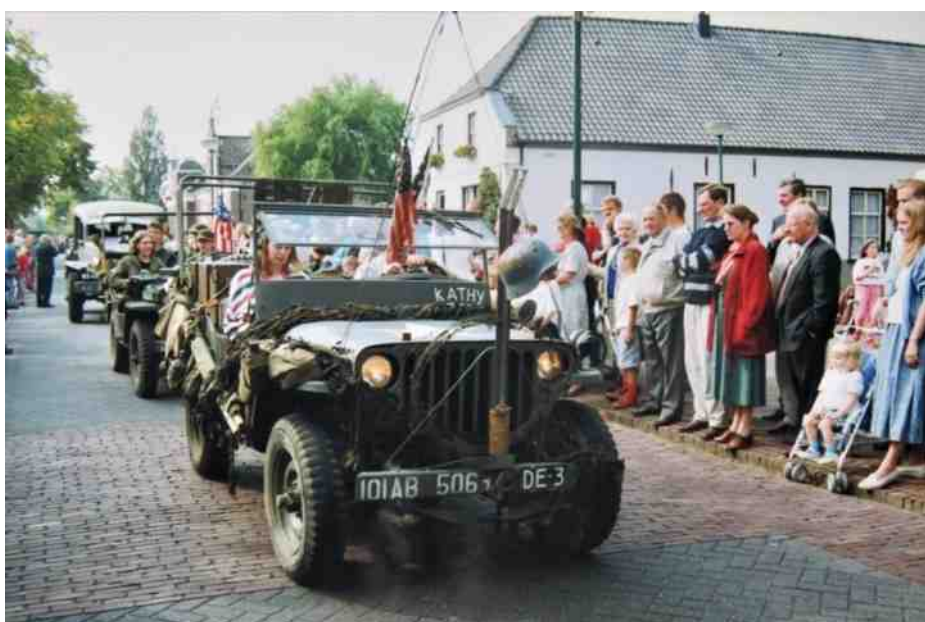
Markante legervoertuigen mochten niet ontbreken!

Eén ervan was de grote historische optocht waaraan talloze Aarlese verenigingen en buurtschappen deelnamen. Het werd een geweldige happening. Hieronder een aantal foto's van deze optocht, met dank aan Ton Swinkels.