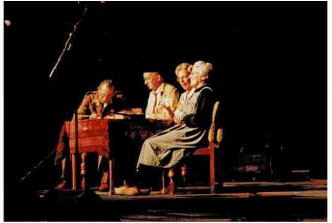
Stamp: geen petazzie maar een postzegel

In de Dreef werd een grote bevrijdingsrevue opgevoerd waaraan zo'n 130 deelnemers meewerkten. De revue werd een enorm succes en kreeg een vervolg met drie optredens in het toenmalige Speelhuis in Helmond. Op deze pagina een foto-impressie van verschillende acts.