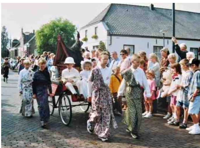
Jeugdige deelnemers beelden het Indisch tijdperk uit