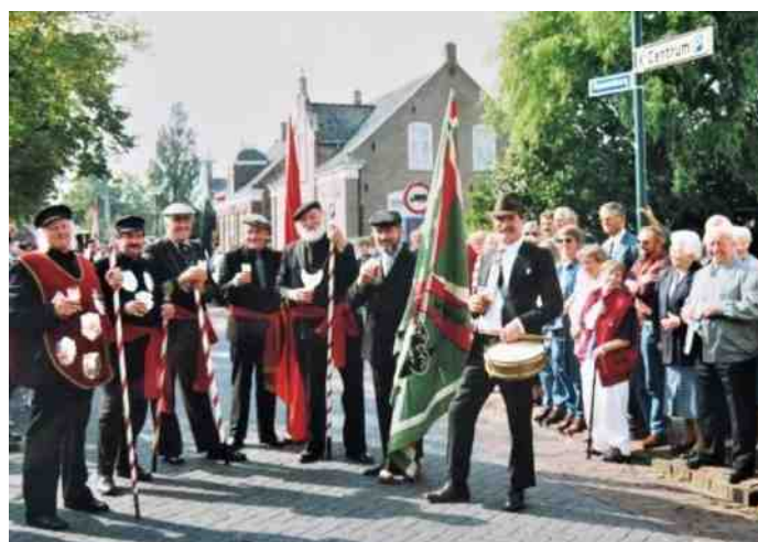
De Rooi Schut in oude outfit