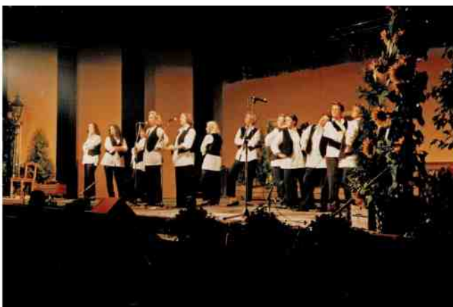
'Vrouwen, vrouwen, vrouwen!', vrouwenemancipatie