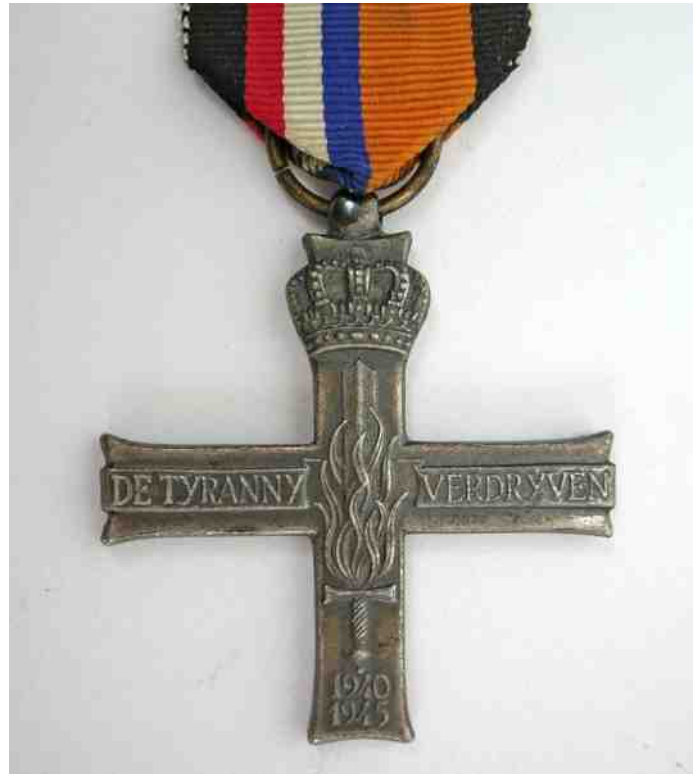
Verzetshedenkingskruis van Noud van den Bogaard

de Wereldoorlog in Nederland ingevoerd. De kaart uitwisselen met anderen was verboden. De tweede distributiestamkaart werd door de Duitse bezetter ingevoerd om de duizenden onderduikers van voedsel af te snijden. Voor het aanvragen van een tweede kaart was namelijk een persoonsbewijs nodig. Onderduikers hadden die wel, maar zouden meteen worden opgepakt als ze zich met hun eigen persoonsbewijs zouden melden voor het aanvragen van de tweede stamkaart. Het was voor hen dus niet mogelijk om in bezit te komen van een tweede kaart, en wie geen stamkaart had, kon geen bonnen krijgen om voedsel en andere goederen kopen. Was het persoonsbewijs wel in orde, dan werd er op het persoonsbewijs en de stamkaart een controlezegel geplakt. Zonder persoonsbewijs dus geen stamkaart. Zonder stamkaart geen voedselbonnen. Deze maatregel heeft er uiteindelijk voor gezorgd dat de verzetsgroeperingen overgingen tot het overvallen van de kantoren waar de bonnen werden bewaard, de distributiekantoren. De aldus verkregen bonnen werden verdeeld onder personen die onderduikers hadden, zodat men alsnog extra voedsel voor de onderduikers kon kopen.