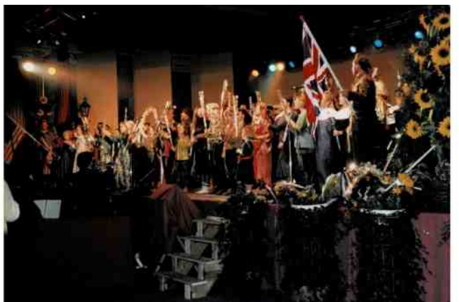
De afsluiting met 'Alle Menschen werden Brüder'