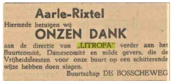
Buurtschap De Bosscheweg behaalde een eerste prijs bij de bevrijdingsfeesten in 1945, onder andere dankzij de gevelversiering van Litrofa (Lieshoutse Tricotage Fabriek).