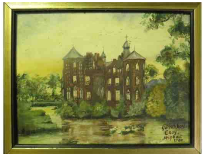
Geschilderd door zuster Adriana Bertens