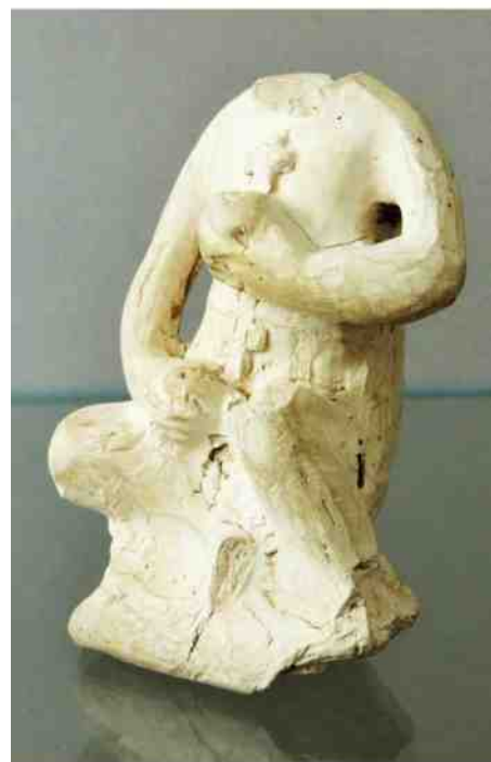
Pijpaarden beeldje, gevonden op de Duivenakkers