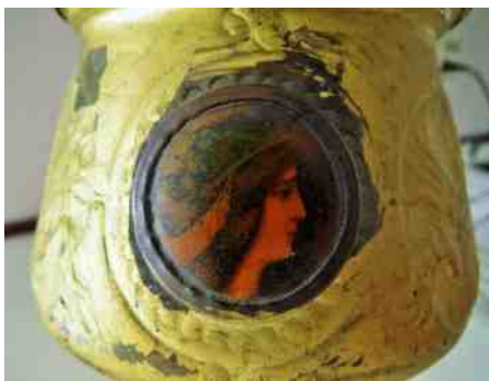
Het olielampje met een van de medaillons

internet, maar ik heb geen enkel exemplaar gevonden dat er op lijkt. Dus wie verder wil speuren, kan aan de slag. De volgende keer kom ik weer met enkele andere 'schaffen' op de proppen.