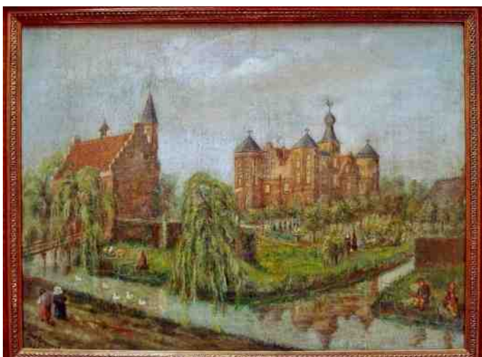
Geschilderd door Hanneske van den Bogaard

Het zijn weliswaar - in kunstzinnig opzicht - geen van drieën belangrijke kunstwerken, maar het gaat om het verhaaltje dat er achter zit.