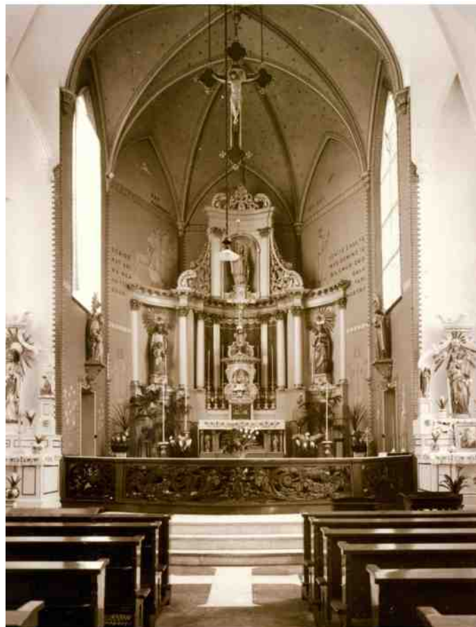
Het altaar in het voormalige Augustinessenklooster Mariendael in Sint Oedenrode

Zoals hiervoor al is aangegeven, behoort het huidige hoofdaltaar in onze parochiekerk ook tot de barokstijl. Omwille van dit artikel heb ik nog enig speurwerk gedaan naar de oorsprong van de drie beelden die zich op dit altaar bevinden: bovenin God de vader en aan weerszijden beelden van Maria en van Johannes de evangelist. Op een foto uit de tijd dat het altaar nog in de 'Rooijse' kloosterkapel stond, bevatte het altaar andere beelden dan die we nu in Aarle hebben. Volgens het boekje dat over onze kerk is uitgegeven zouden de huidige beelden afkomstig zijn uit de voormalige kerk van Lieshout. Echter, ik heb verschillende foto's van het interieur van die kerk bekeken, maar kon die beelden niet ontdekken. Bovendien wordt eerder in datzelfde boekje beschreven dat het barokke hoofdaltaar voor 1100 gulden van de zusters Augustinessen is gekocht mét beelden en versieringen. Dus, dan zou je weer denken dat dat de huidige beelden zijn. Maar zoals gezegd, op foto's van het altaar toen zich dat nog in het Augustinessenklooster bevond, zie je heel andere beelden. Kortom, het blijft voorlopig een raadsel waar de huidige beelden vandaan komen. Het altaar is er niet minder mooi om. Althans, dat vind ik!