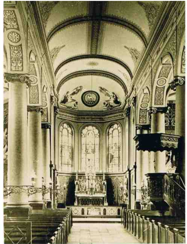
De foto's op deze pagina geven een beeld van het interieur van de kerk in Lieshout

De barok is een kunststroming die vooral wordt gekenmerkt door uitbundige versieringen. De barok uitte zich in verschillende kunstvormen zoals de architectuur, de schilder- en beeldhouwkunst, de literatuur en de muziek. De barok ontstond rond 1600 in Italië, terwijl men toen in andere delen van Europa nog in de renaissancestijl bouwde en schilderde. Over de barok is veel informatie te vinden, ook op internet. De barok borduurt voort op de renaissance, maar heeft daarnaast veel eigen kenmerken. De renaissance streefde naar orde en stabiliteit, de barok streefde naar het grootste, het verhevene. Het woord 'barok' betekent in het Nederlands 'onregelmatig, grillig, overladen'. In de barok ligt de nadruk op het spectaculaire en het emotionele. Er wordt veel gebruik gemaakt van contrasten, bijvoorbeeld tussen licht en donker, massa en leegte. Ook bogen en diagonalen zijn een kenmerk van de barok. De invoering van deze stijl werd met name ingegeven door de contrareformatie. 'Contrareformatie' is een naam die door protestantse historici het eerst werd gebruikt, omdat ze ervan uitgingen dat