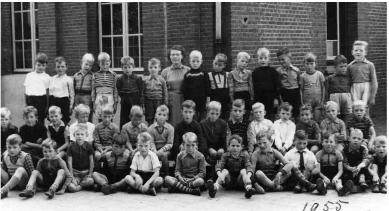
Klas 1 van de Sint-Josefschool in 1955.