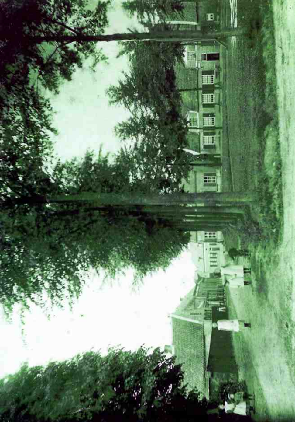
Zicht op de Kouwenberg rond het jaar 1910 met o.a. de schutsboom van het Gilde Sint Margaretha