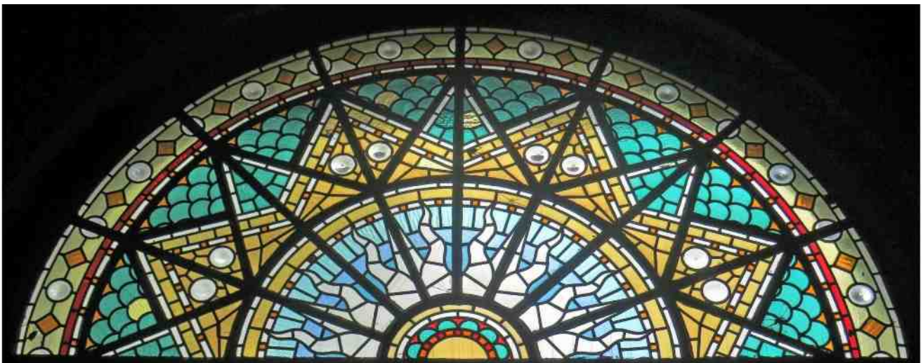
Bovenlicht boven grote deur van de kerk in Aarle-Rixtel