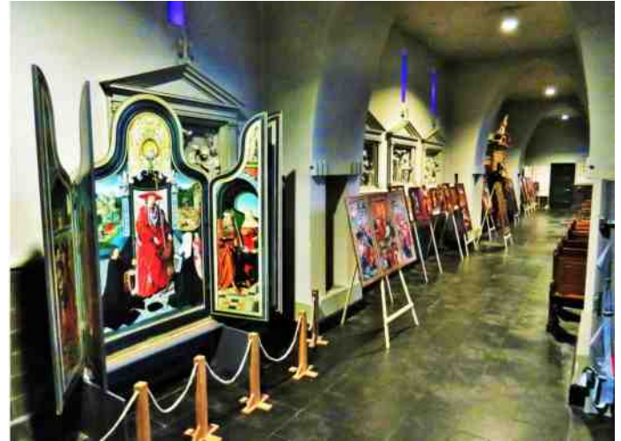
Expositie Jacob van Oostsanen in de kerk in Aarle-Rixtel