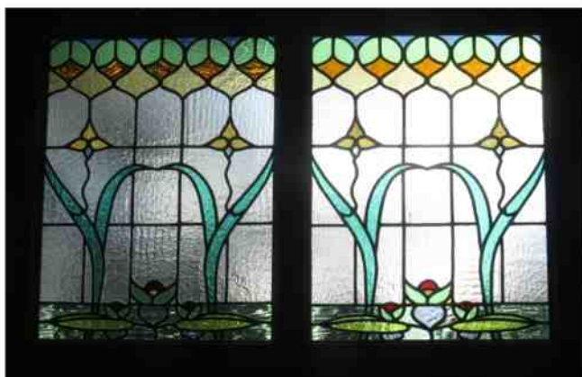
Bovenlicht achterdeur pand hoek Dorpsstraat/Helmondseweg