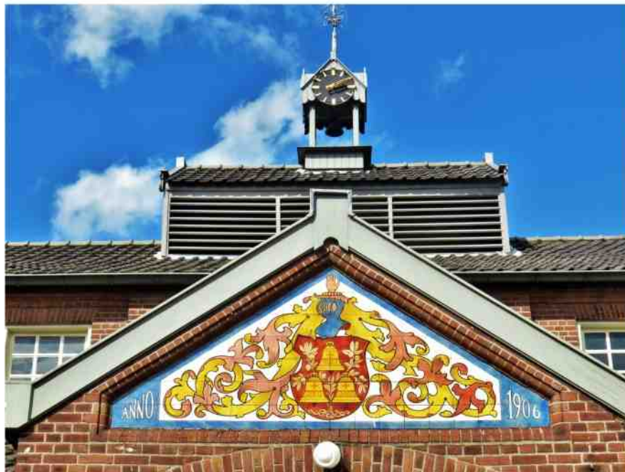
De voormalige Klokkengieterij Petit en Fritsen aan de Klokkengietersstraat

Jugendstil gebeiteld. En wat te zeggen van de hiernaast gelegen voormalige kosterswoning met zijn overmatige versieringen? Tot slot ben ik nog even naar onze Mariakapel aan de Bosscheweg gegaan. Ook daar verwijst een aantal elementen van het interieur naar Jugendstilkenmerken. Zoals de beide zijaltaren, die qua vormgeving weliswaar verwijzen naar de neogotiek, maar waarvan de beschilderingen duidelijke kenmerken van de Jugendstil tonen, net als de wandversieringen. Kortom, het was voor mij alszins de moeite waard deze speurtocht te maken.