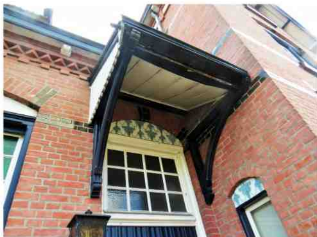
Luifeltje boven voordeur van het pand hoek Kanaaldijk/Klokkengietersstraat