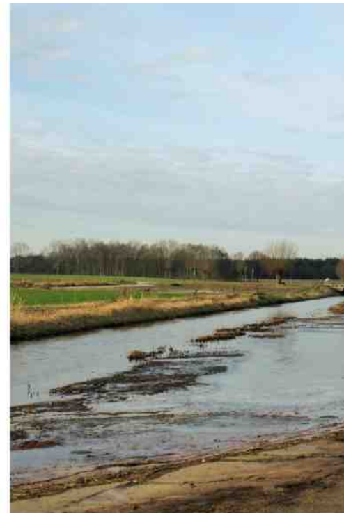
De nieuwe plas-dras-berm