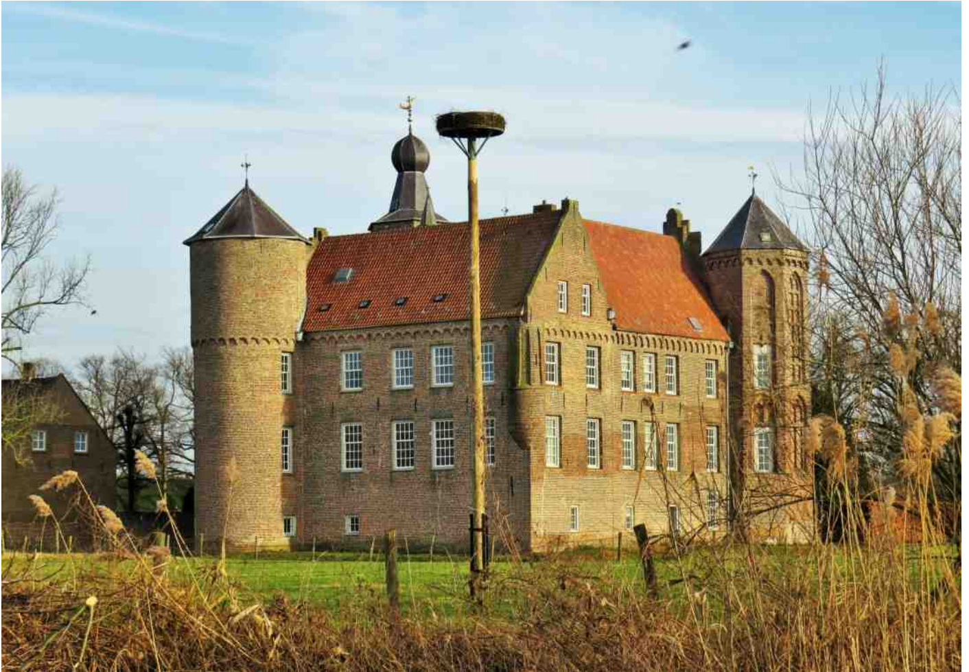
Het vernieuwde ooievaarsnest