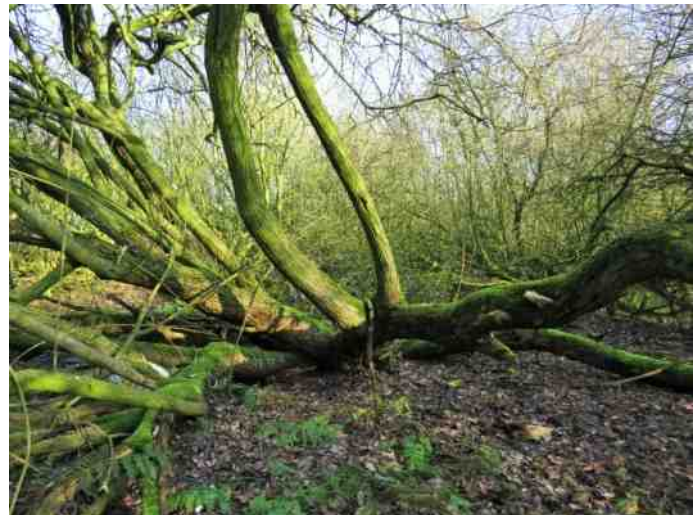
Moerasje met wilgenopslag