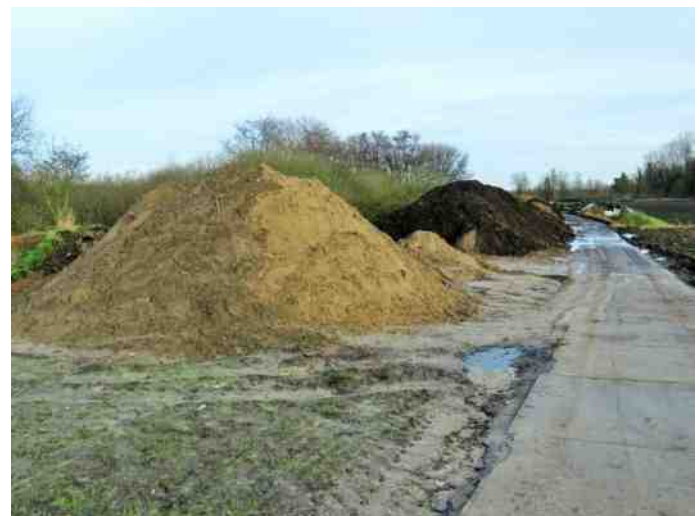
Zandbergen vormen een bedreiging