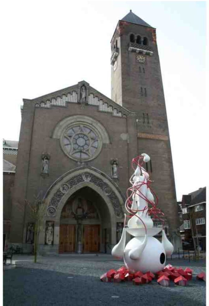
De voormalige Jacobskerk