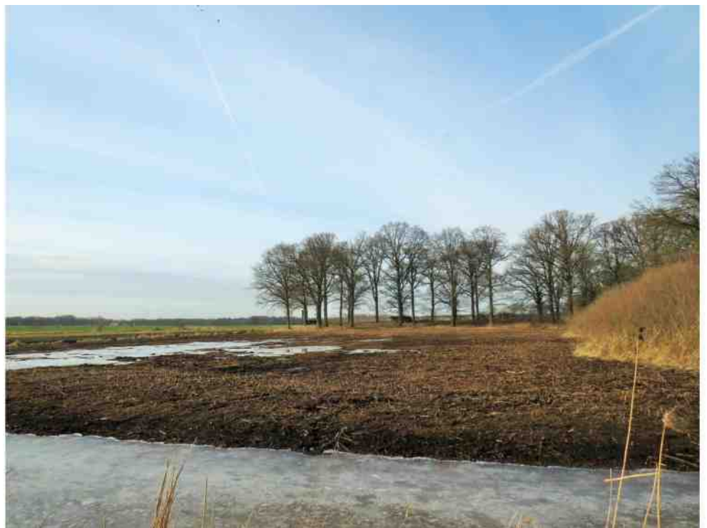
Het verschaalde laagveengebiedje