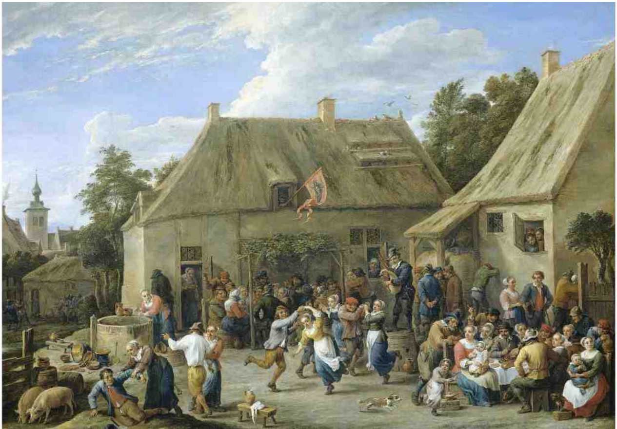
Land Kermis van David Teniers de Jonge (1650)

Wereldoorlog werd de kermis op de Kouwenberg gehouden, later verhuisde die naar het Heuveltje. Tussendoor heeft de kermis ook nog ooit aan de Dokter Timmersstraat gestaan. Al deze informatie kun je in het archief vinden.