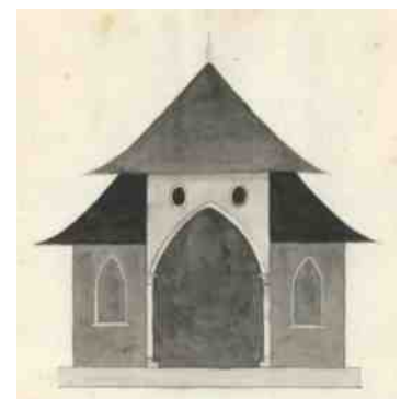
Ontwerptekening van de oorspronkelijke Spaanse schop