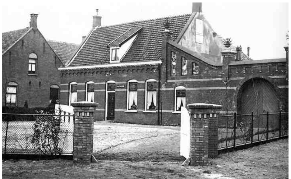
Huize Zonnety heeft een rijke bewoningsgeschiedenis

[1] Sigmund Schlomo Freud was een neuroloog uit Oostenrijk-Hongarije en de grondlegger van de psychoanalyse. Hij was van joodse afkomst.