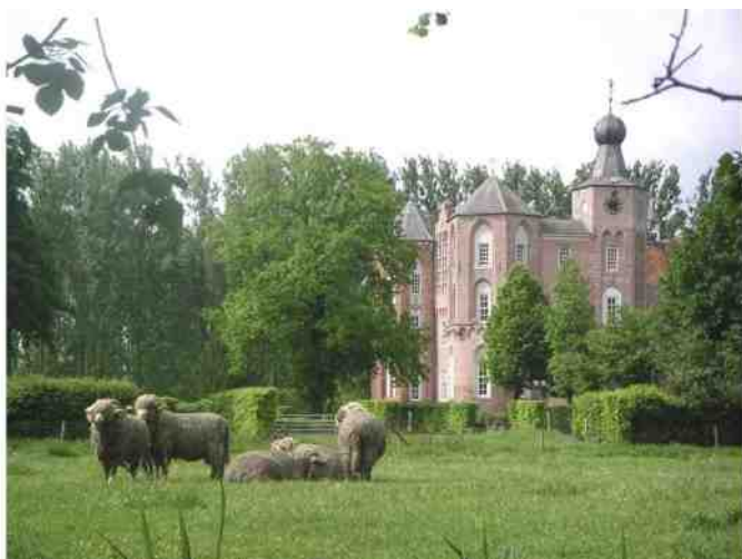
Merinosschappen op Croy