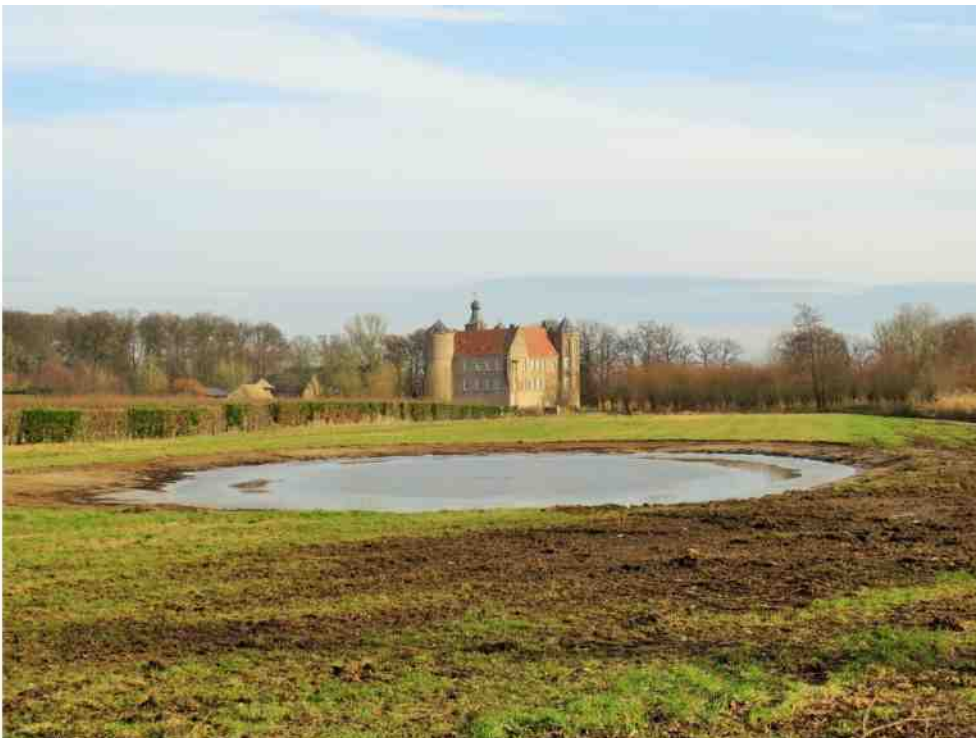
Een van de nieuwe poelen

Ondertussen gaat Laarbeek 'Europees' voor de titel "Groenste gemeente van Europa." Wij wensen de gemeente daarbij veel succes. Wil Laarbeek echter ooit de "Meest natuurrijke gemeente" worden, dan kunnen ze niet om Aarle - en zeker niet om Croy - heen!